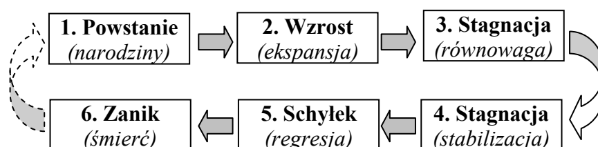
Rys. 24. Cykl życia organizacji [41]

Organizacja przechodząc od koherentności do addytywności, ztraca cechy sprawnościowe w wyniku tzw. jej starzenia się bądź odradzania się. Starzenie się organizacji jest procesem nieuchronnym i nieodwracalnym, a rozrastanie się polega na zmniejszeniu się koherentności systemu przez usamodzielnienie się poszczególnych elementów i wyodrębnienie się ich z całości organizacji. Koncepcja cyklu życia organizacji opiera się na założeniu, że organizacje, podobnie jak organizmy żywe, rozwijają się fazowo – rys. 24 [41].